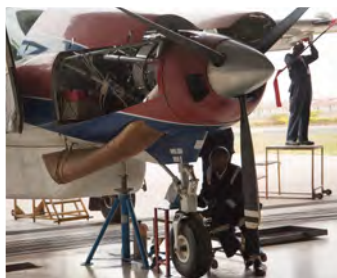
MAF:n kone tarkastuksessa.