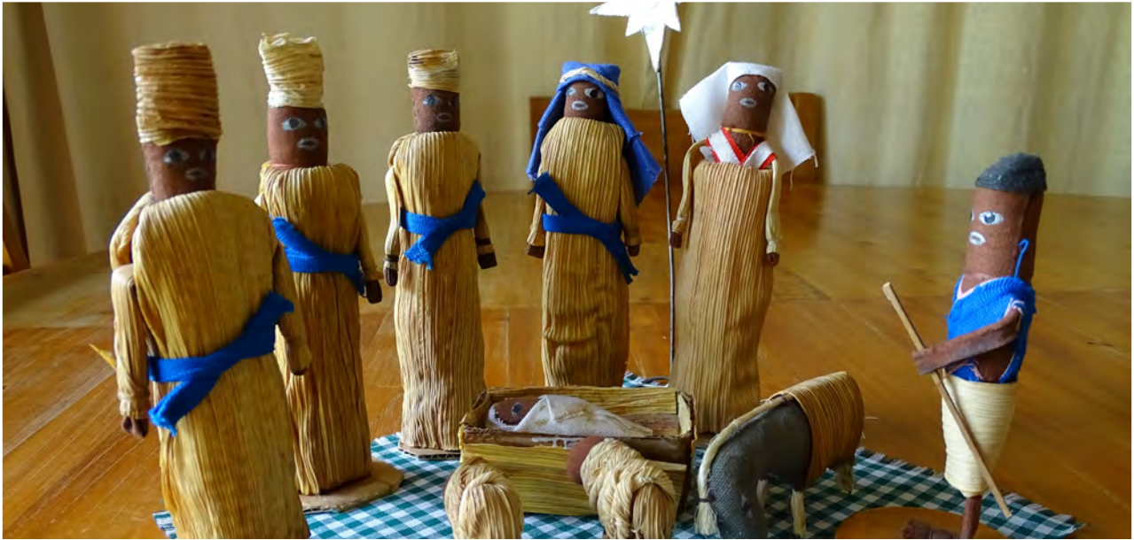
Sillä lapsi on syntynyt meille, poika on annettu meille. Hän kantaa valtaa harteillaan, hänen nimensä on Ihmeellinen Neuvontuoja, Väkevä Jumala, lankaikkinen Isä, Rauhan Ruhtinas." Jes. 9:5