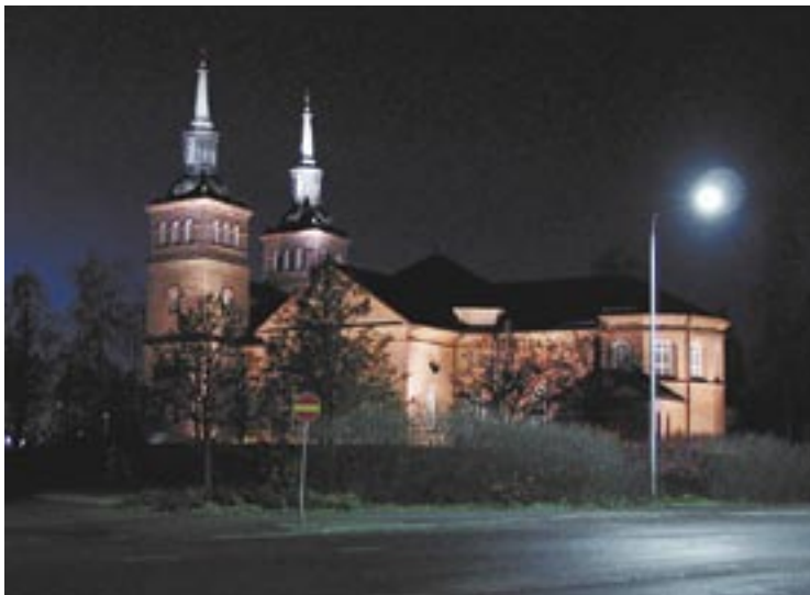
Tyrvään kirkon kaksi tornia risteineen loistavat tulevaisuudessa pimeälläkin.

Tyrvään kirkon ulkovalaistus korjataan kesän aikana, ja adventtina 150-vuotisjuhlissaan kaksitorninen loistaa pimeällä jopa Turku-Tampere-tielle asti.