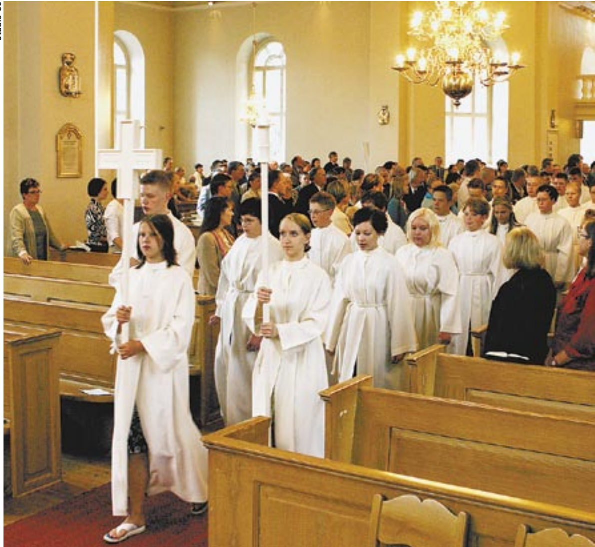
Konfirmoitavat tulevat ristikulkueena Tyrvään kirkkoon.