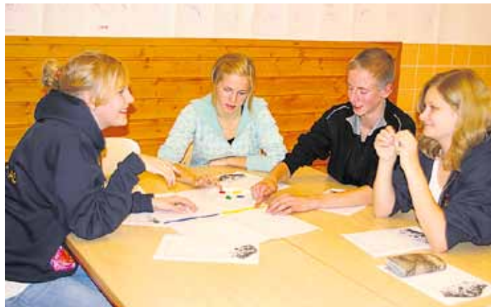
Pyhän teemaa sivutaan myös ripareilla. Kuvan nuoret ovat syksyn isokoulutuksen osallistujia.

– Rauhan ja tasapainaisuuden käsittämätön tunne, jonka luonnossa, usein metsässä tai meren tai järven rannalla tuntee, voi olla jotakin lähellä pyhää.