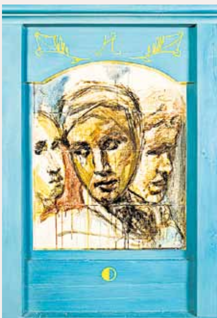
Kuutti Lavonen: Jerusalem in itkevät naiset.

Ihanat värit loistavat alkusyksyn auringossa. Tuttu turkoosi hehkuu. Jostain mieleeni nousee virrensäe: "Aurinko on ristin päällä valkea ja punainen" (Vk 105).