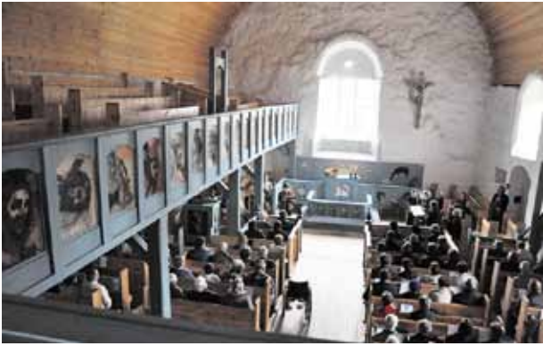
Syyskuussa kirkossa vietettiin sadonkorjuun kiitosmessua.