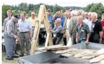
Ensimmäisessä teemaillalla Tyrvään talkoolaiset tapasivat taas toisiaan, kertoivat kokemuksiaan ja näyttivät, kuinka niitä paanuja oikein veistettiin.