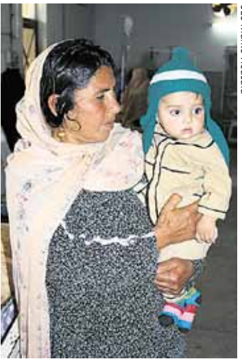
S/S Marko Heusala