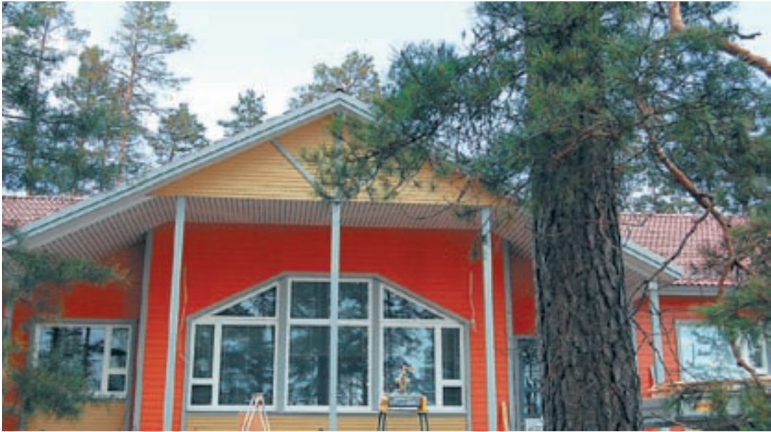
Leirimajan uusi majoitusrakennus nousi mäntykankaan korkeimmalle kohdalle.