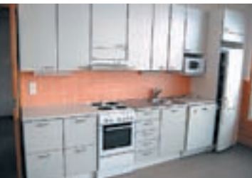
Uudessa talossa on myös moderni keittokurkkaus.