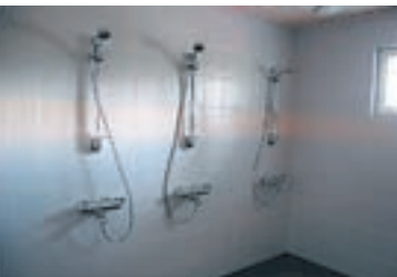
Leirikeskukseen huoneiden yhteyteen on saatu myös nykyaikaiset peseytymistilat.