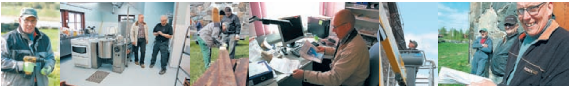
Rakennusmestari sukkuilo sujuvasti virastolta vanhallekirkolle, Suodenniemen Salmista Tyrvään pappilaan. Viime viikkoina Pitkämäki on välillä melkein asunut Leirimajalla, missä on kuumeisesti tehty uuden majoitusrakennuksen lopputöitä ja sen lisäksi muun muassa pikkupirtin keittiöremonttia.