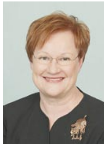
– Suomalainen talkootyö on hieno yhteisöllisyyden ilmentymä, kehuu tasavallan presidentti Tarja Halonen.

– Jokainen meistä on tärkeä, ja sen pitäisi kannustaa ja velvoittaa lähimmäisen tukemiseen. Suomalainen talkootyö on hieno yhteisöllisyyden ilmentymä. Globalisaatio ja paikallisuus eivät sulje toisiaan pois. Ihminen asuu aina jossakin. Meidän tulee ottaa muuttajat vastaan ja kannustaa heitä juurtu-