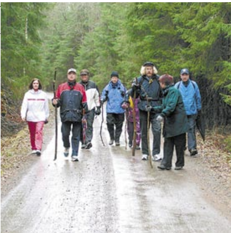
Korpitietä ja kuusikko mahtuu Karkusta Tyrvään kirkolle apostolinkyydillä matkaavan tielle. Lähetysjuhlien päätoimikuntalaiset koevaelsivat reitillä toukokuun alussa.

Näky on jalostunut valmiiksi tuotteeksi niin sutjakkaasti, että mies itsekään ihmettelee. – Kaikki palaset ovat vain naksahdelleet kohdalleen. Koko ajan on ollut ihmeellinen tunne, kuinka hyvin tämä etenee. Olen turvallisin mielin ajautunut virran vietäväksi.