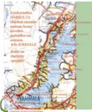
vanha asemakartta.