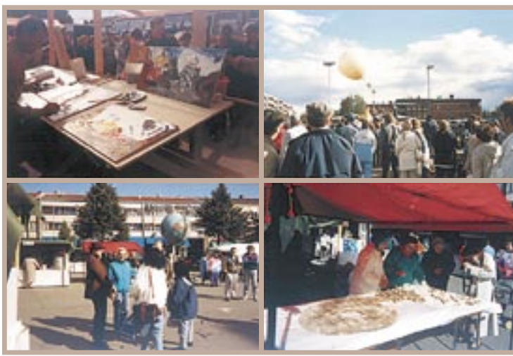
Neljännesvuosisadan aikana syyskuun toisena perjantaina Vammalan torilla on taiteiltu, lähetetty lähetysviestejä ilmojen halki, myyty leivonnaisia – ja tapailtu tuttuja.

lähellä, vaikka sitten ostamalla pussillisen ryynejä tai jauhoja.