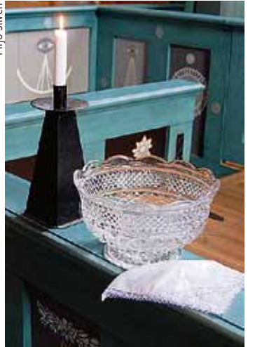
Pyhässä kasteessa otettiin viime vuonna 213 vauvaa seurakunnan yhteyteen, nimeltä mainiten.

viikimisten osuus ev.lut. avioliittojen määrästä oli Sastamalassa 67,3 prosenttia (koko maassa Tilastokeskuksen tietojen mukaan 63,3 prosenttia).