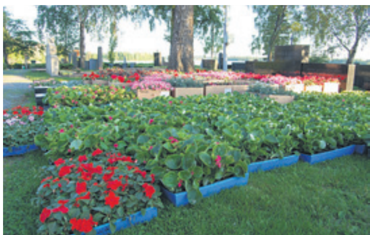
Seurakunnan hoitohaudoille istutetaan tänä vuonna 14 244 kukkaa.

Lähetysjuhlat 5.–7.6. Tampereella. Ohjelma ja paljon muuta tietoa nykypäivän lähetystyöstä osoitteessa www.lahetysjuhlat.fi