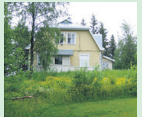
Salmin leirikeskus on Suodenniemellä.