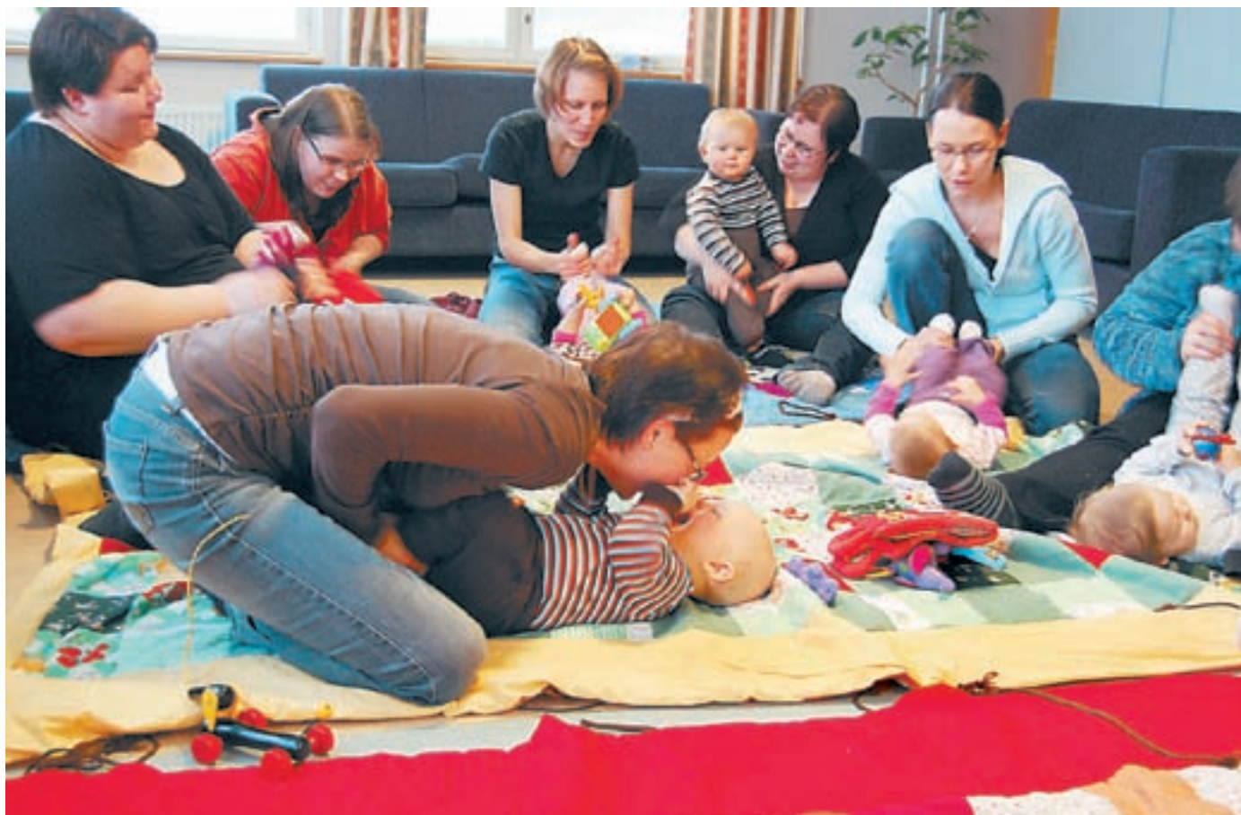
Äidit ja esikoiset vauhdissa – vauvakerhon kokoontumisessa jutellaan, mutta myös leikitään ja lauletaan.