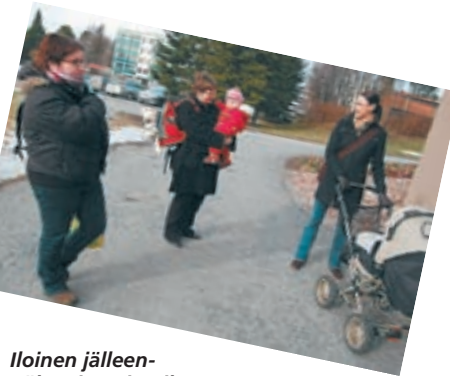
Iloinen jälleennäkeminen jo pihassa.