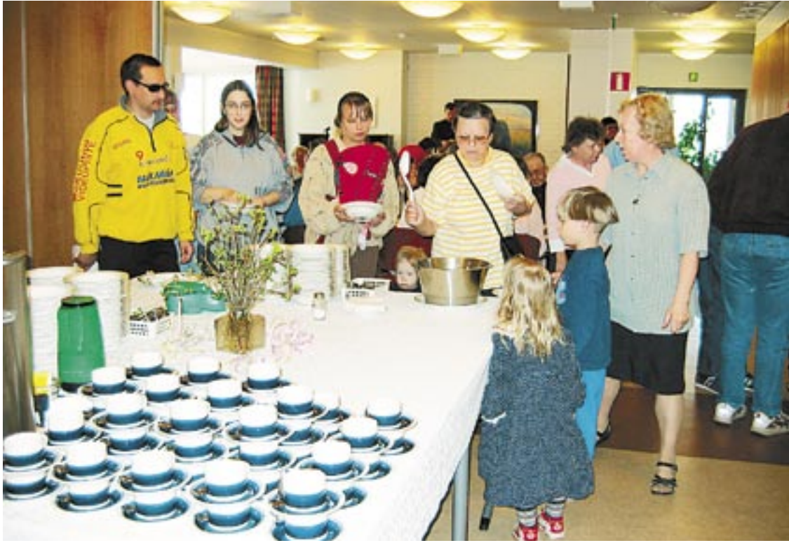
Torstailounas kokoaa ruokapöydän ääreen väkeä vauvasta vaariin. Tänään on tarjolla lohisoppaa ja marjapuuroa.