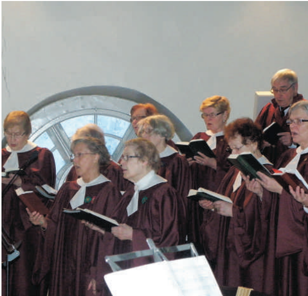
Tyrvään kirkkokuoro palvelee seurakuntaa sillä tavalla, jonka parhaiten osaa, eli laulamalla.