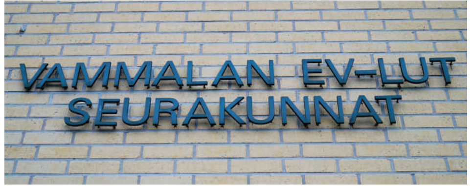
70-luvulla syntyneestä Tyrvään ja Karkun seurakuntayhtymästä on vieläkin muisto Vammalassa.

Yhtymää kuitenkin kannattavat suurten kaupunkien