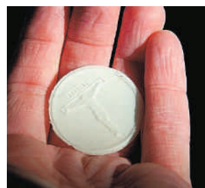
Avohoidon sielunhoidon tarpeen kasvaessa seurakunnan ja terveydenhuollon yhteistyö on yhä tärkeämpää.

Kaivattaisiin avoimia keskusteluryhmiä, jotta vanhukselle voisivat tuoda esiin mieltään vaivaamia asioita. Muistisairaudet ovat lisääntyneet ja muistisairaana messu keran kuussa hartauden tilalta