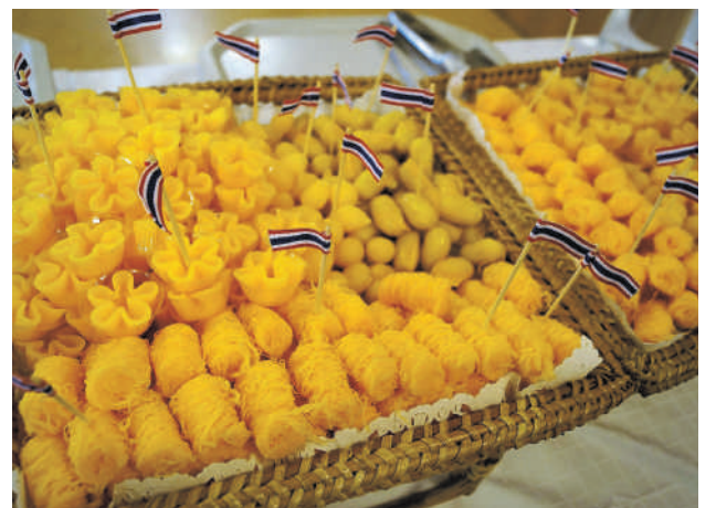
Kananmunankeltuaisesta ja sokerista tehtyä jälkiruokaa sai syödä myös silmillään.