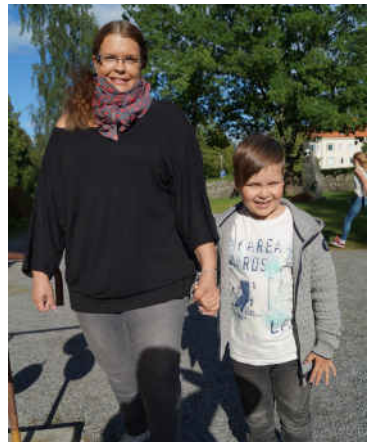
Äidit ja lapset olivat Tyrvään kirkolla ekaluokkalaisten siunaustilaisuudessa.