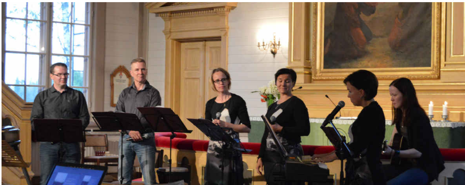
Majatalo-illoissa musisoidaan ja mietitään elämän suuria kysymyksiä.