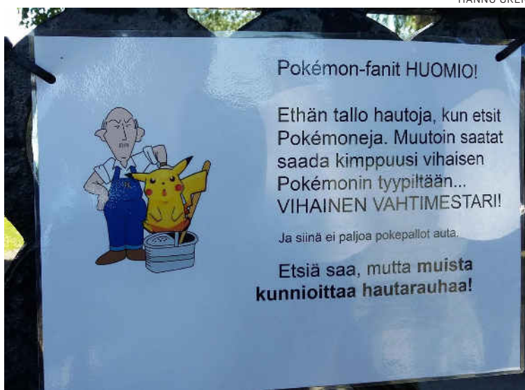
Tyrvään kirkon portin kyltti sai verkossa kiitosta jopa Pokémon-faneilta.