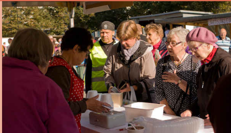
Lähetystorin tunnelmaa viime vuodelta.

Torilla on myös lähettien haastatteluja, musiikkia ja muuta ohjelmaa. Päivän tuotto menee Sastamalan seurakunnan lähetystyön hyväksi. Torilla tavataan!