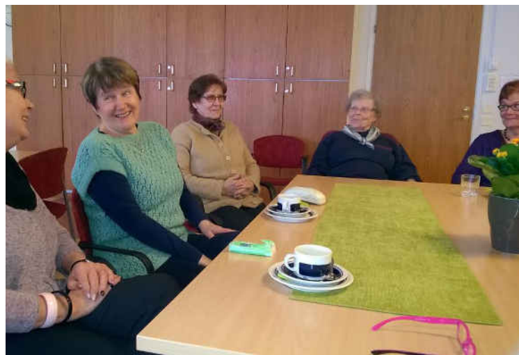
Leskien klubissa voi puhua mistä vain – ja välillä vaikka hymyilläkin, kun siltä tuntuu.

ja jutusteltu sekä jaettu omia kokemuksia – iloja, suruja ja selviytymistarinoita. Ryhmässä on tuettu muita saman kokeneita, mutta siellä on keskusteltu myös tavallisista arki-