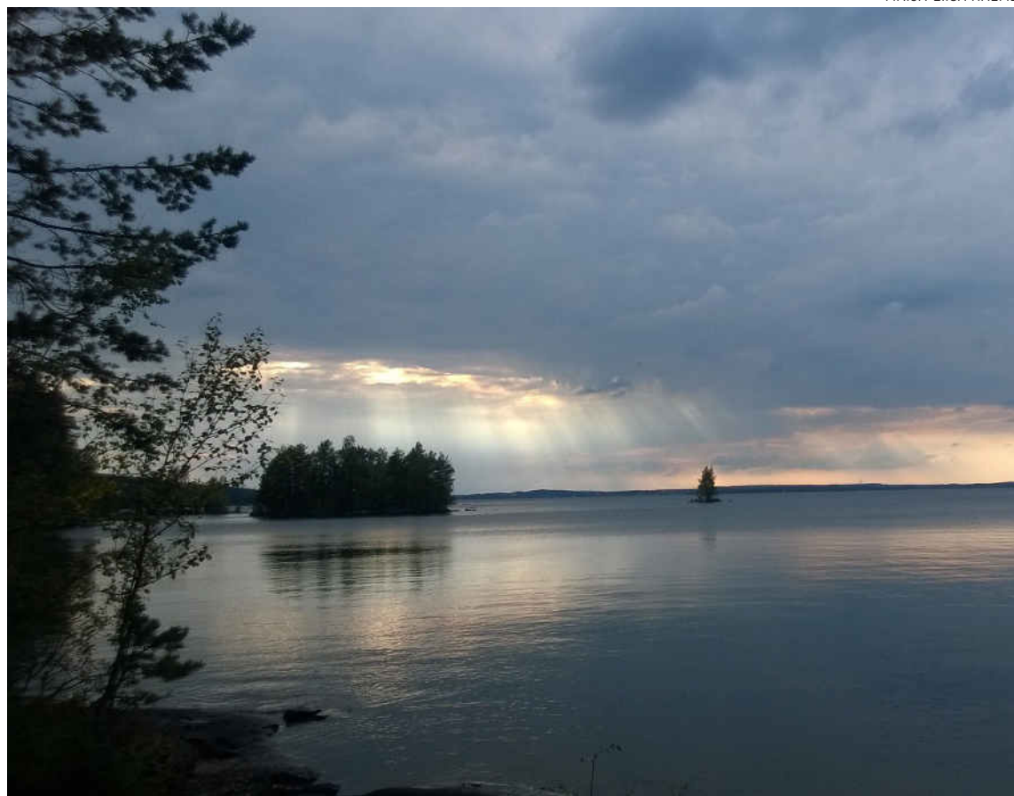
Saattohoidon vapaaehtoiset tarjoavat tärkeää tukea viimeisen siirtymän edessä.

Terttu Sulanne on asumisyksikön esimies Sotesissa. Hän kertoo, että asumisyksiköissä tarvitaan vapaa-