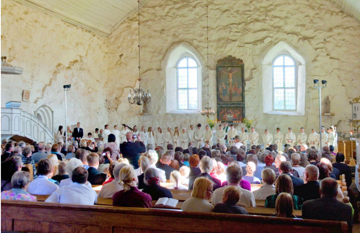
Rippikoulu on yksi suosituimmista kirkon työmuodoista. Pyhän Marian kirkko on toiminut jo vuosisatojen ajan useiden sukupolvien rippikirkkona.