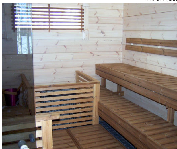
Tupaa ja saunaa vuokrataan yleisön käyttöön Sastamalan kirkkoherranvirastosta.

Ensimmäisenä ja alueen maisemaan eniten vaikuttavana muutoksena oli vuonna 2007 käynnistetty ja vuosina 2008–2012 toteutettu hautausmaan laajennushanke. Hankkeen kustannukset oli-