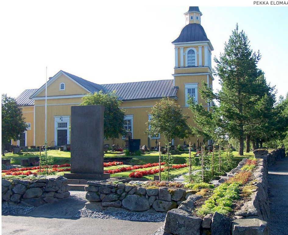
Kirkonmäki-projekti pääsi täyteen vauhtiin vuonna 2011.

Kiikoisten pappilasta/virastosta päätettiin luopua heti kirkkoherran eläköityessä ja kanttorilasta luovuttiin jo vuonna 2003. Toimintoja haluttiin keskittää seurakuntatalolle, jonne saneerattiin uusia tiloja.