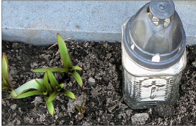
KYNTTILÖIDEN ja muiden talvella haudalle tuotujen esineiden siivoaminen keväällä pois kuuluu haudanhaltijalle.

”Haudan hoidon ei tarvitse olla työlästä ja sitovaa. Nykyisin on olemassa pal-