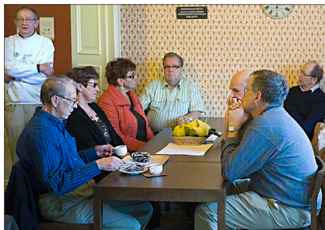
...SITTEMMIN on siirrytty Pukstaaviin.

taa olla aito ja avoin. Keskustelijoita on ollut yleensä 20–30. Tämä toimintavuosi on