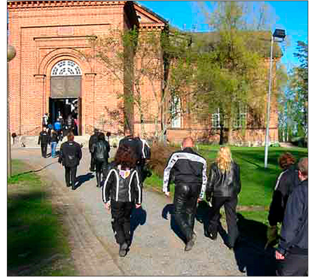
MOUHIJÄRVEN motoristikirkkoon matkataan 23. toukokuuta.