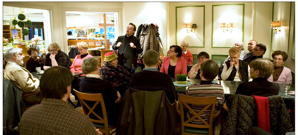
AJATTELIJOIDEN klubin kokoontumiset käynnistyivät Pyymäen kahvilassa...

Kokemuksemme työryhmän jäsenenä ovat olleet