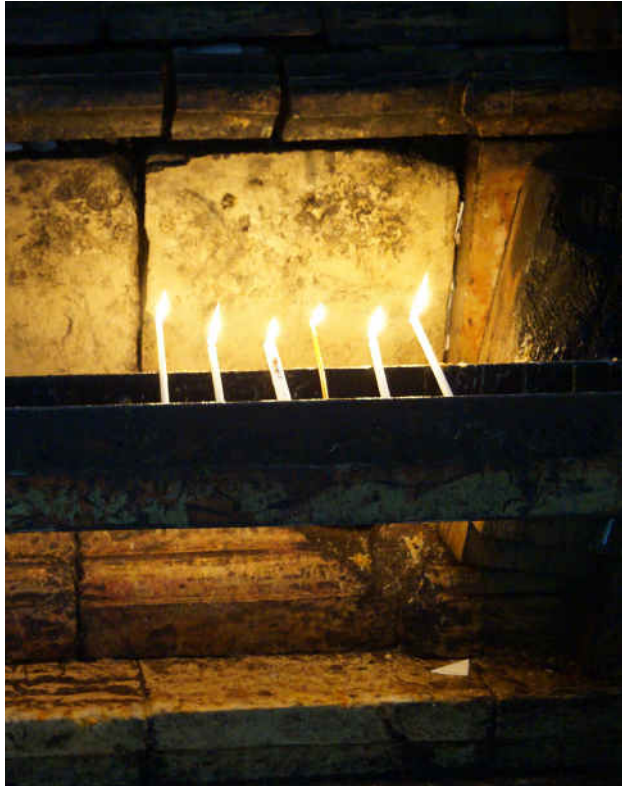
Jerusalemien Vanhassa kaupungissa sijaitseva Pyhän haudan kirkko on yksi maailman vanhimmista kirkoista.

Tilanne muuttui olennaisesti 300-luvun alkupuolella, sillä keisari Konstantinus kääntyi kristinuskoon vuonna 312. Tämän ratkaisun myötä kristinusko sai Rooman imperiumissa virallisen hyväksytyksen aseman. Noihin aikoihin virisi valtakunnan kristittyjen piirissä innostus tehdä pyhiinvaellusmatkoja Jeesuksen elämästä tutuille paikoille. Tähän pyhiinvaeltajien joukkoon liittyi myös Konstantinuksen äiti Helena vuonna 325. Hänen kerrotaan löytäneen matkallaan Jeesuksen ja kahden ryövärin ristit. Todennäköisesti hänen aloitteestaan ristiinnaulitsemisen paikan,