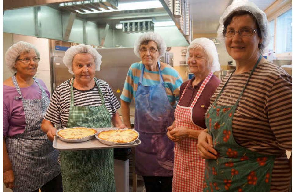
Vapaaehtoisten käsissä syntyy herkkuja myyjäisiin.