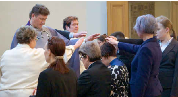
Seitsemän työntekijää saa siunauksen tehtävänsä.

Eri tavalla ajattelevia on kohdeltava tasa-arvoisesti ja lähdettävä keskusteluun heidän kanssaan. Heidän tarkoituseriään voi ymmärtää, mutta samaa mieltä ei tarvitse olla eikä hyväksyä heidän tekojaan. Kun on tehnyt rikoksia muita ihmisiä, lähimmäisiä kohtaan, kuten terroristit, niin on vastuussa omista tekemisistään eikä voi syytellä niistä muita. Kyseiset teot ovat hyökkäys sananvapautta vastaan.