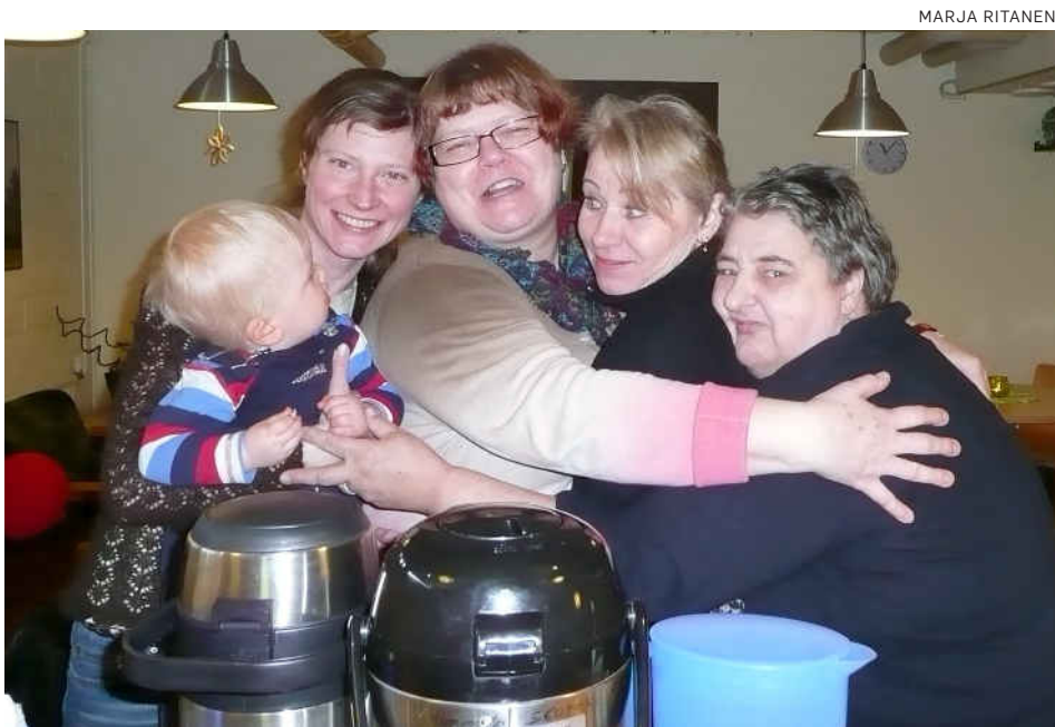
Diakoniakahvilaa pyörittämässä on mukana vapaaehtoisia.