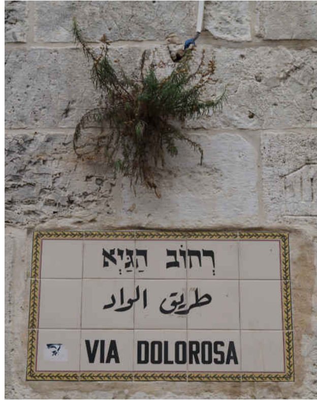
Monet kristityt osallistuvat vuosittain vaellukselle, joka seuraa sitä reittiä, jota Jeesus perimätiedon mukaan kulki Pontius Pilatuksen palatsilta Golgatalle.

myös Egyptin, Syyrian ja Etiopian vanhoille kirkkokunnille. Näin laaja eku- meenisuus lienee ainutlaatuista maailmassa, mutta tietysti hyvin ymmärrettävää tämän kirkon kohdalla, kuuluhan sanoma syntien sovituksen ja ylösnoussesta Kristuksesta kaikkien kirkko- kuntien ytimeen. Tällä pai-