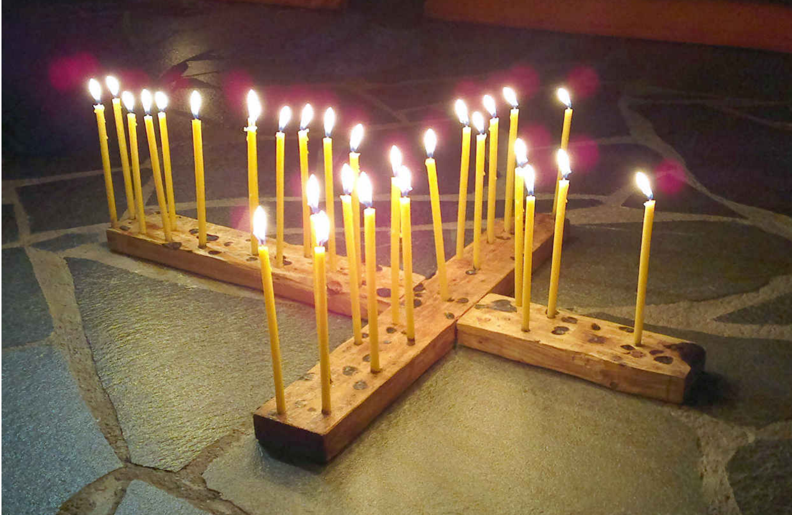
Pääsiäisen toivo elää yhä tänä päivänä.