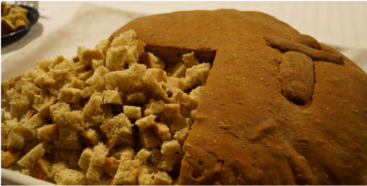
Yhteinen leivän murtaminen yhdisti jo Jeesuksen opetuslapsia.