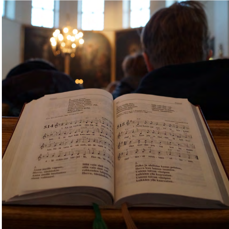
Adventtina otetaan käyttöön virsikirja, jossa on 79 uutta virttä.

Luvassa on hienoa musiikkia ja varmasti mahtava kokemus. Tämä on mahdollista vain yhteistyöllä. Sinua tarvitaan - tule rohkeasti mukaan!