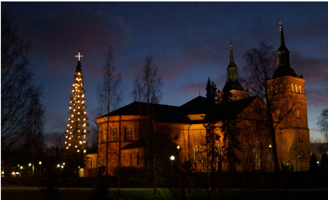
Tyrvään kaksitorninen oli viime vuonna joulukirkko yhteensä 1500:lle ihmiselle.