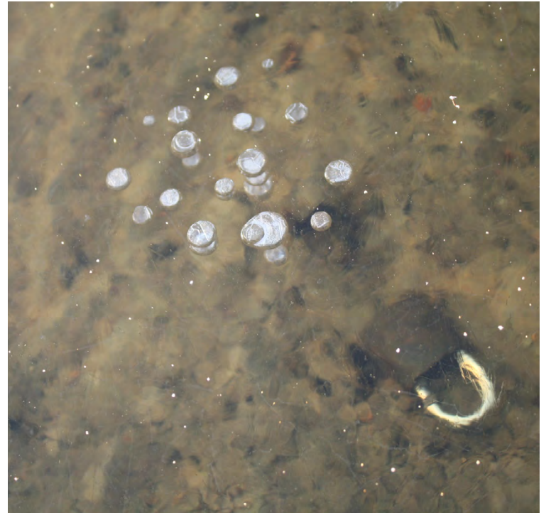
Jumala voi avata meissä syvälläkin olevat lukot.

Oli siis vielä yksi mahdollisuus. En halunnut hukkoa maailmaan.