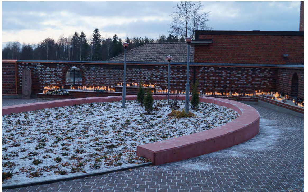
Laajennettu muistolehto on kaunis ja avara.