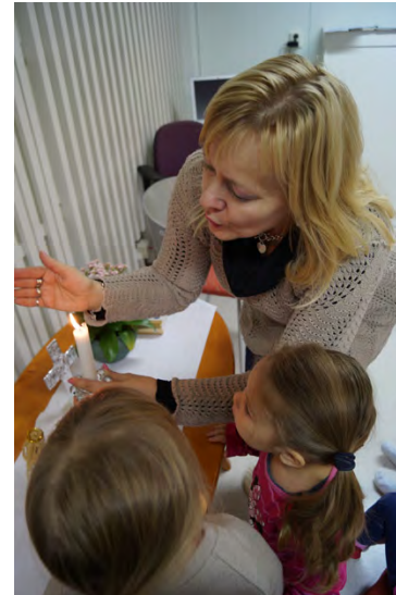
Kynttilän sytyttäminen on kerhossa tärkeä juttu - ja sammuttaminen myös.

livat minua. Siivottuani paikan kuntoon olin valmis seuraavaan kohteeseen. Työparini kanssa lähdimme Suodenniemelle päiväkerhoa pitämään. Matkaa on nelisenkymmentä kilometriä, joten ehdimme vaihtaa kuulumisia.