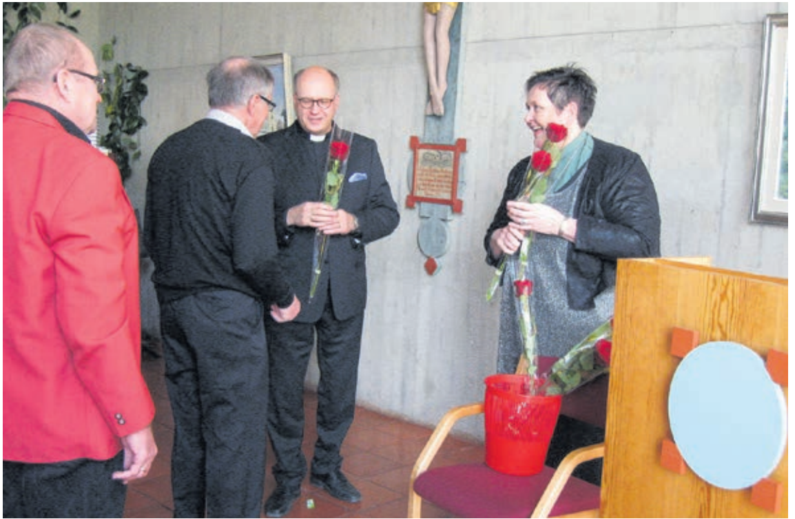
Seurakunta on jo pitkään kutsunut 70- ja 75-vuotta täyttäviä yhteiseen syntymäpäiväjuhlaan. 80- ja 85-vuotiaiden määrä kasvaa lähivuosina niin nopeasti, että myös heidän osaltaan harkitaan siirtymistä yhteisiin juhliin.

Vaikka periaatteessa omaisille ei jää varsinaisia hoitotoimenpiteitä muistolehdossa, niin heidän tulee pitää alue siistinä ja olla viemättä sinne tavaroita, jotka eivät sinne kuulu. Esimerkiksi lasiset tai keraamiset esineet eivät kestä siellä sääolosuhteita ehjinä.