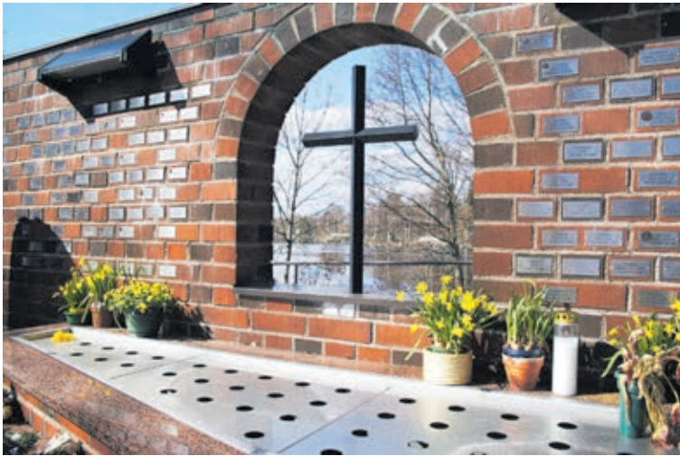
Tyrvään kirkon muistolehtoa laajennettiin vuonna 2016. Samalla kukkien las- kutilaa lisättiin, valaistus uusittiin ja kasvillisuutta uudistettiin.