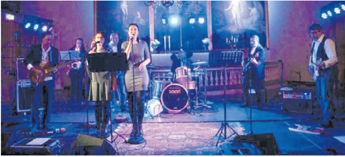
Tyrvään kirkossa järjestettiin syksyllä 2018 bluesmessu, jonka musiikista vastasi Ison Kirkon Rankinbluesband.