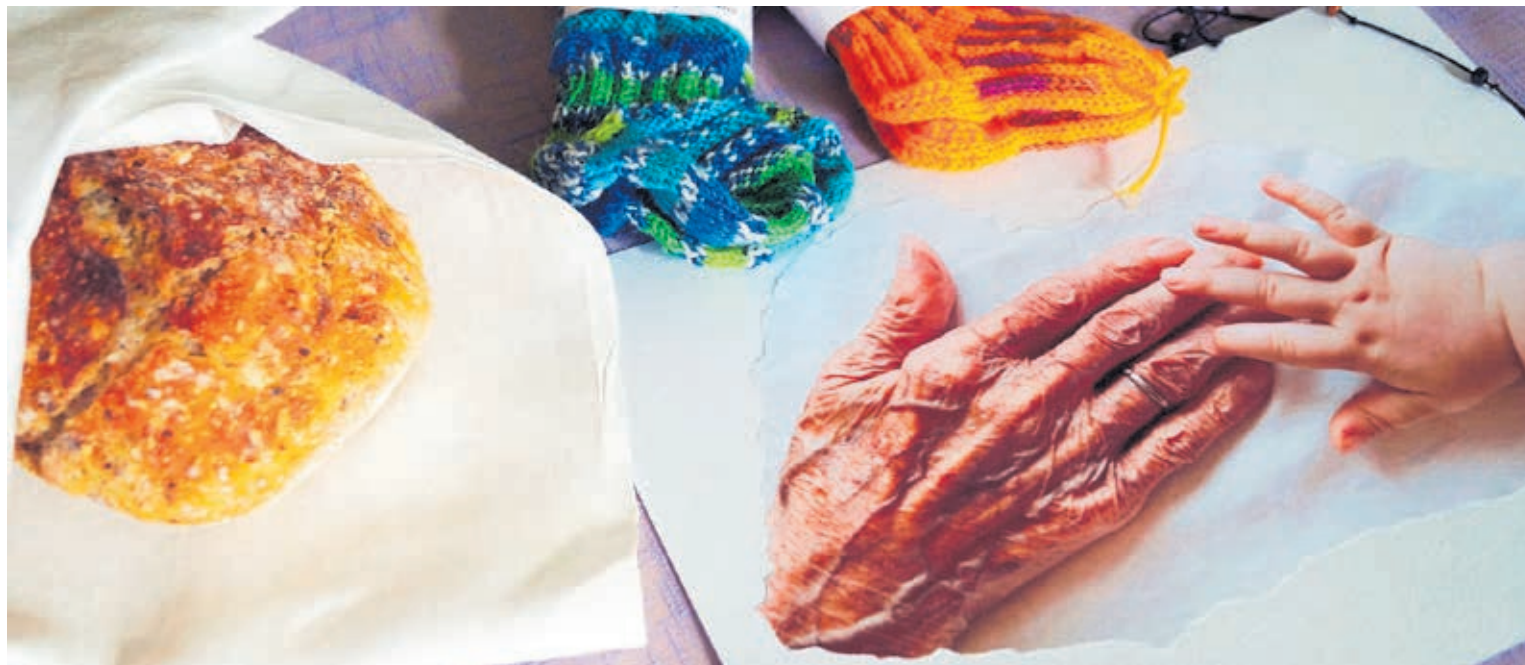
Seurakunnan muodostavat sen jäsenet, suuret ja pienet. Jokaisella on oma tärkeä paikkansa.