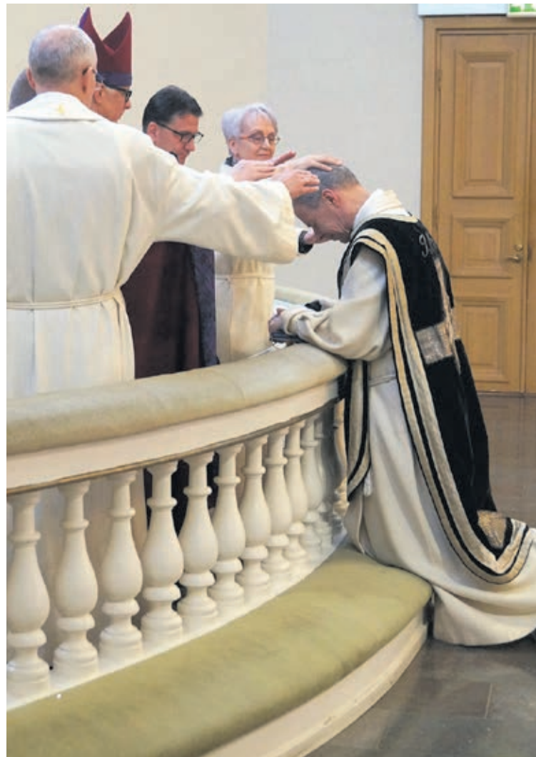
Siunatkoon sinua kolmiyhteinen Jumala, Isä ja Poika ja Pyhä Henki, ja pyhitäköön sinut palvelemaan Kristuksen kirkkoa tässä seurakunnassa.