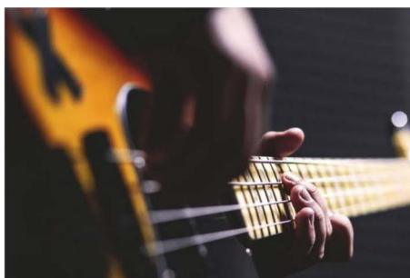
Torstaina 29.11. kello 19 Tyrvään kirkossa koetaan jotain uutta – messu, joka soi bluesin rytmillä.

Vaikka blues ei ole Suomessa koskaan ollut valtavirtaa, on täällä koko joukko bluesmuusikoita. Merkittävä joukko paikallisia