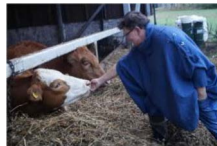
Työ tekijäänsä kiittää, toteaa Kipa. Hyvinvoivaa suomenkarrjaa kelpaa esitellä.