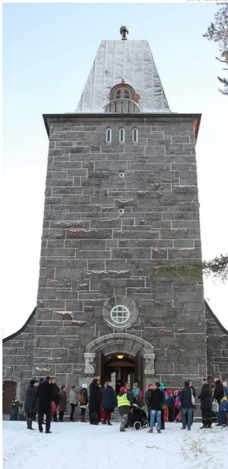
Yhteisöllisyyttä luodaan yhdessä tekemällä. Kuva Karkun kirkolta itsenäisyyspäivänä 2017.

Ruohonjuuritasolta nouseva messu voi parhaimmillaan olla niin antoisa, että sinne ei voi olla menemättä.