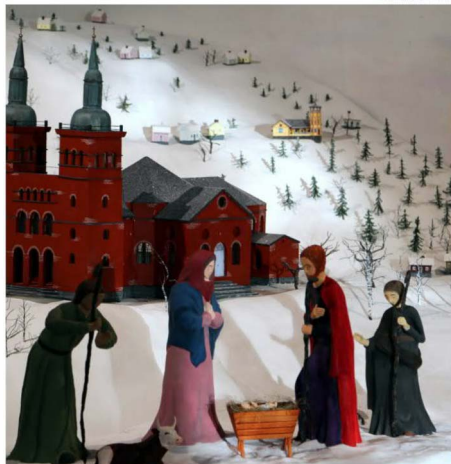
Tyrvään Käsi- ja taideteollisuusoppilaitoksen opiskelijoiden rakentama sei- miäsetelmä on ihailtava Tyrvään kirkkossa ensimmäisenä adventtina.

Hoosianna-kirkko sopii hyvin niin isolle kuin pienille ja kovin mainiosti koko perheelle. Kiiva olisi, jos saisimme näistä kirkoi- sta myös palautetta – oli se sitten puolesta tai vastaan.