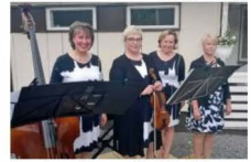
Aggabee-yhtye on Hyvän mielen joulukonsertin kantava voima.