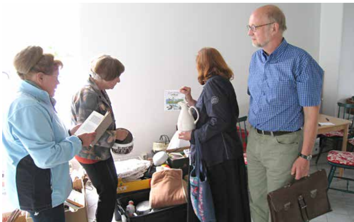
Ahkerat työläiset ovat jo sisustamassa kirpputorin uutta toimipistettä käyttövalmiuteen.

paile seurakunnan muilla alueilla olevien kirpputorien kanssa, vaan asiassa on oma alueellinen korostuksensa. Järvi ajattelee, että vaikka tulijoita toivotaan kauempaakin, niin paikallisten kappeliseurakuntienkin kirpputoreilla on oma merkityksensä.