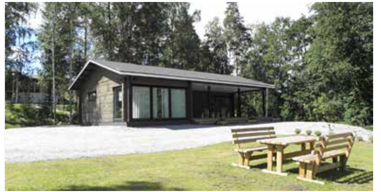
Kiikoisten kirkkotupa tarjoaa sauna- ja oleskelutilat esimerkiksi pienimuotoisiin perhejuhliin.

Mutta onko tämä sittenkään kovin uutta ja outoa? Onhan kirkkoisamme laulettu jo vuodesta 1701: ”Kiitos Jumalallemme soikoon sydämeistämme virsin, lauluin, psal-tarein, harpuin, huiluin, kantelein.” (Virsi 332:3)