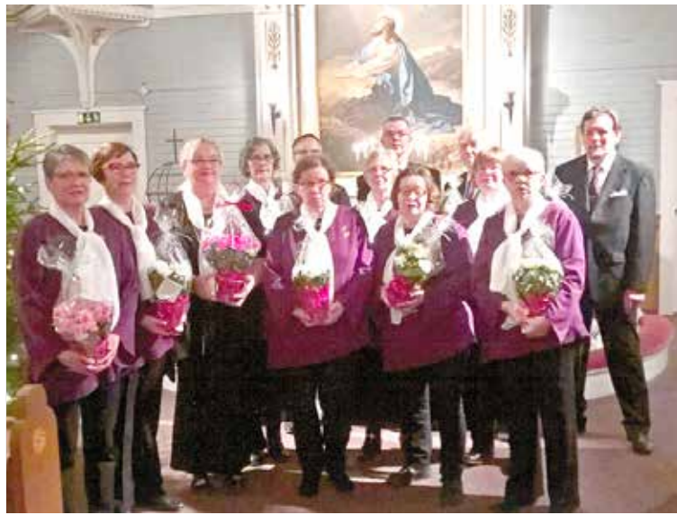
Kiikoisten kirkkokuoro kaipaa uusia laulajia. Samoin kaipaavat myös Karkun, Mouhijärven ja Tyrvään kirkkokuorot.

Tällä hetkellä kuoroomme kuuluu 12 laulajaa. Vanhimmat ovat liittyneet kuoroon peräti 1960-luvulta, uusimmat nyt aivan viime vuosina. Ohjelmistomme koostuu osin perinteisestä kirkkomusiikista mut-