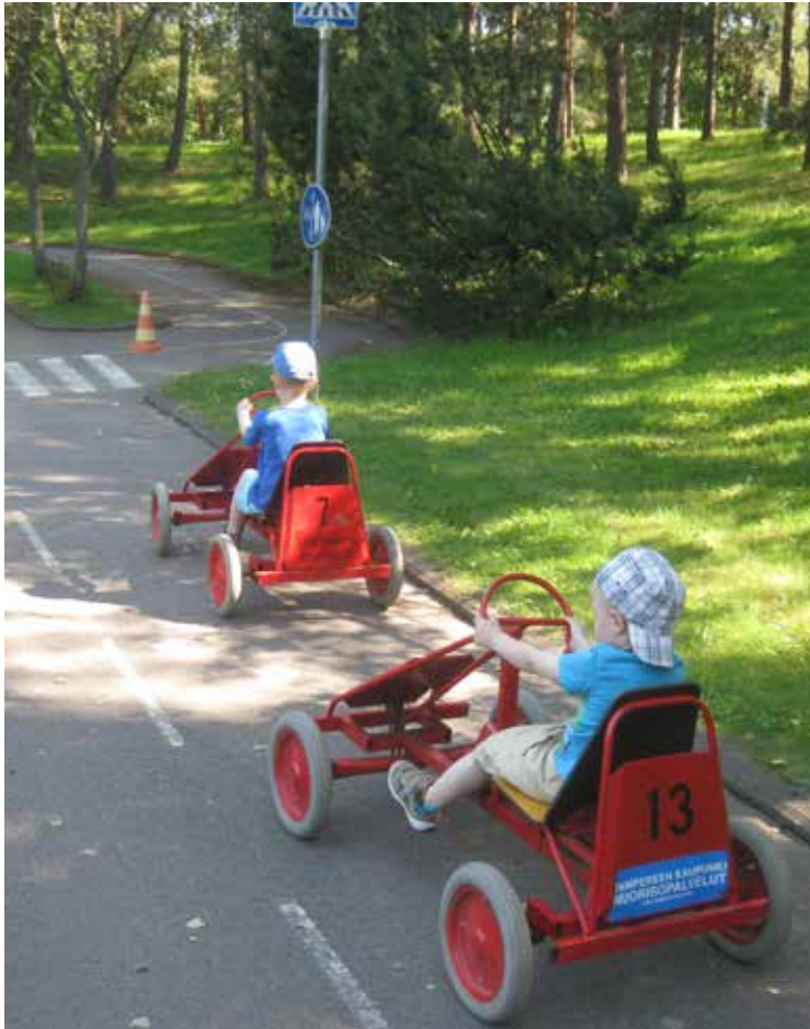
Kummius voi merkitä myös luontoretkeä tai liikennepuiston polkuautoa.

Kirkkoon kuulumaton ei voi toimia kummina. Jos lähipiiristä ei löydy kummiksi sopivia henkilöitä, kummeja voi kysyä myös seurakunnasta.