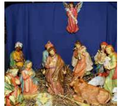
Italialainen jouluseimi Seimipolulla.