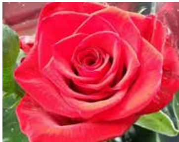
Seurakunnan käyttämä onnitteluruusu on saanut Sastamalassa lempinimen ”papuruuusu”.

Sastamalan seurakunnassa on tapana viedä päivänsankareille tuomiseksi pitkä, syvänpunainen ruusu. Kukkakaupassa tätä ruusua onkin alettu kutsua ”papuruusuksi”. Onnittelukortissa on Tyrvään Pyhän Olavin kirkon kesä- tai tal-