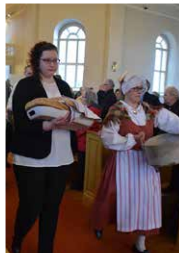
Sadonkorjuusta kiittäminen on vanha perinne, mutta ajankohtainen tänäänkin.