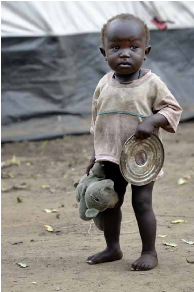
Mikä voi olla parempi lahja kuin lahjoittaa ruokaa sitä vailla olevalle lapselle?

Toisenlainen lahja antaa iloa useammalle. Lahjan antajan ja saajan lisäksi lahjasta koituu konkreettista hyötyä apua tarvitsevalle ihmiselle.